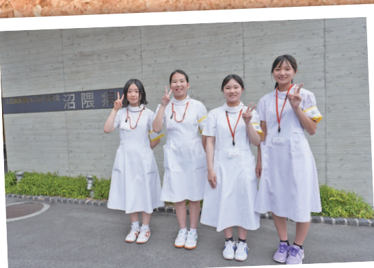
尾道東高等学校、鹿島朝日高等学校、 福山誠之館高等学校、尾道北高等学校