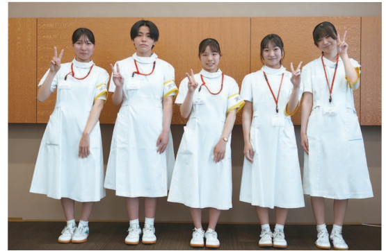
福山葦陽高等学校、松永高等学校、 福山市立福山高等学校