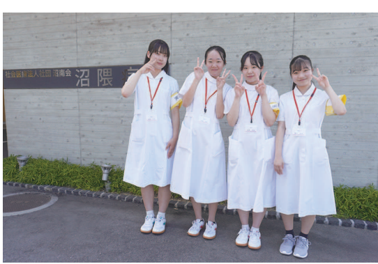
福山葦陽高等学校、盈進高等学校、 福山明王台高等学校