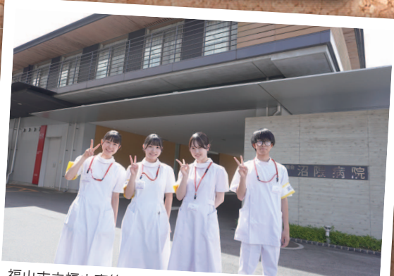
福山市立福山高等学校、尾道北高等学校、 尾道東高等学校