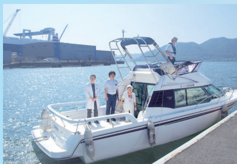
離島・百島への訪問診療