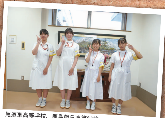
尾道東高等学校、鹿島朝日高等学校、 福山市立福山高等学校