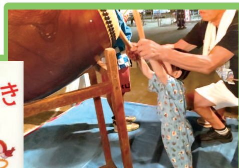
福山市 東陽台夏祭りにて

「だいすきぎゅっぎゅっ」 ぶん フィリス・ガイシャト ミム・グリーン え デイヴィッド・ウォーカー やく 福本友美子