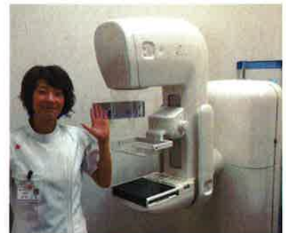
女性技師によるマンモグラフィ検査