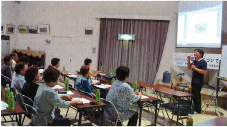
福祉を高める会・まちづくり推進委員会