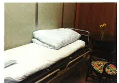
胃がん検診時の休憩室の様子

検診金額は年齢やお住まいの地域によって異なります。その他、生活習慣病予防健診などの受付もしています。病院受付へお気軽にお問い合わせください。