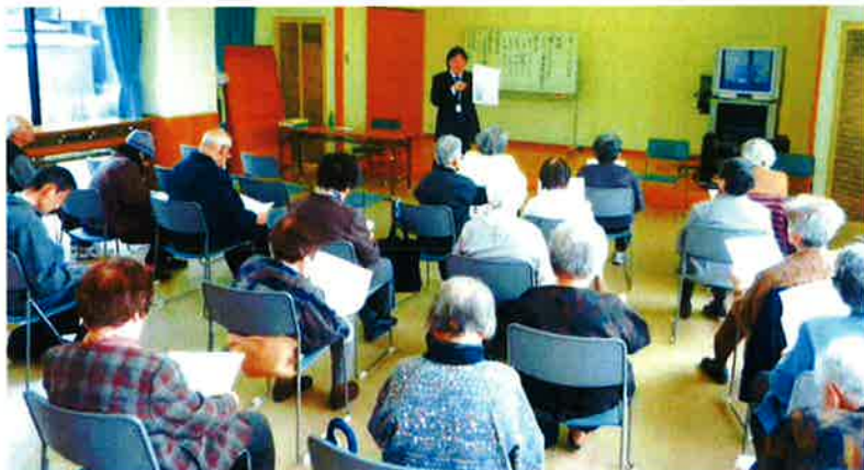
内海さくらんぼの会