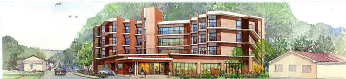
【特集記事】2013年5月開股予定 介護付高齢者向け住宅(特定施設)