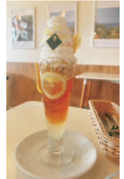
観音山フルーツパーラー尾道店 「レモンパフェ」 (向島町)