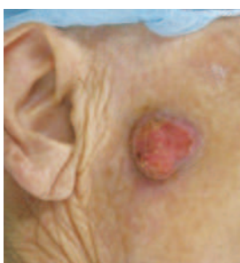
Fig3: 扁平上皮癌(有棘細胞癌)

ボーエン病は、表皮内のみに限局した扁平上皮癌です。体幹、四肢などの日光にあたらぬ非露光部皮膚に発生することが多いですが、手背や症例1の頬部のように、日光の露光部にも発生することがあるようです。