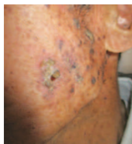
Fig2: 日光角化症(老人性角化症)