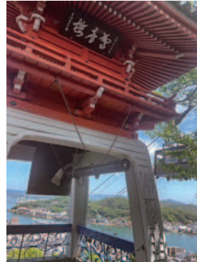
千光寺（東土堂町） 「驚音楼」

なぜ今まで知ろうと思わなかったのだろう。自分の住むまちに自信が持てる体験になりました。皆様も魅力溢れるまち尾道に是非来てみてください。