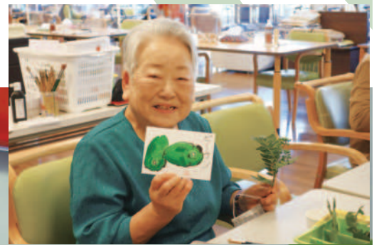
まりデイケア山南 絵画教室