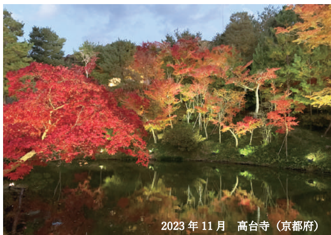
2023年11月 高台寺(京都府)

高台寺を訪れたのは今年の11月24日でしたが、紅葉はまだ半ばくらいで少し緑が残っているような頃でした。その後2-3週間は見頃が続いたように記憶しています。今年は昨年よりもう少し遅くに見頃が来るのではと予想されているようです。