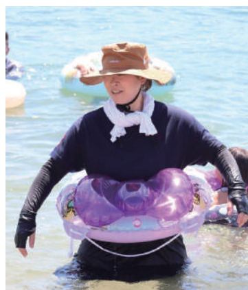
10 数年ぶりの水着姿？

案の定、娘たちはすっかり日焼けしてしまい、しばらく痛みが引かずに苦しんだようですが、家族と友達と過ごしたこの素晴らしい一日を振り返ると、その痛みも良い思い出です。来年はしっかりと日焼け止めを塗って、また家族で海を楽しみたいと思います。