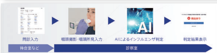
アイリス株式会社 内視鏡用テレスコープ「nodoca(ノドカ)」