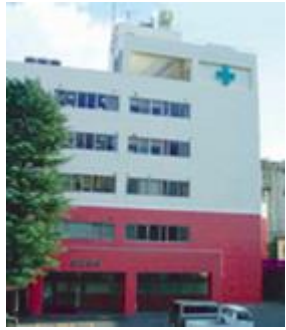
常石医院 グループホームぬまくま