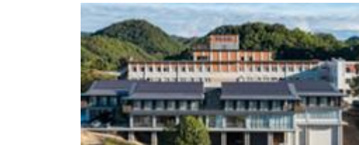
地域密着型特別養護老人ホーム まり沼隈