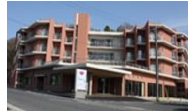
まり高齢者複合施設 山南