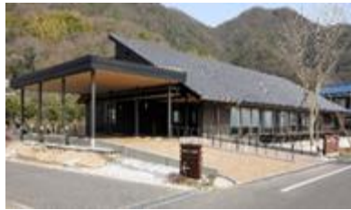
まりデイサービス内海