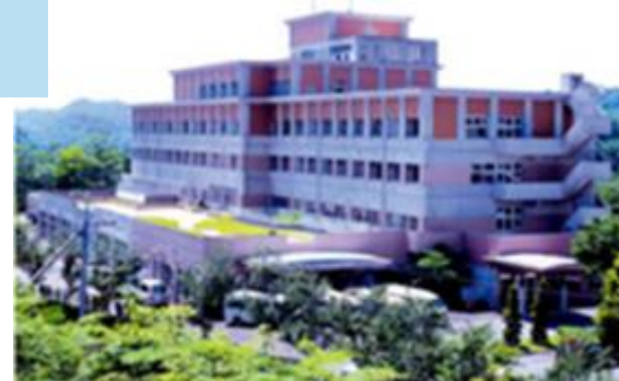
沼隈病院・介護老人保健施設ぬまくま